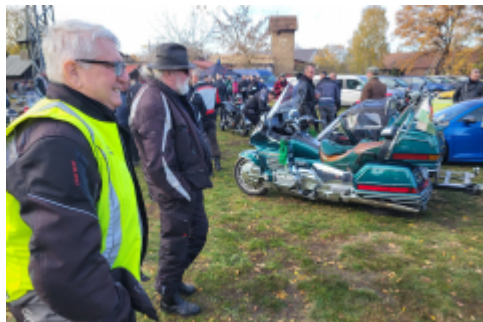
stauenan auf dem Parkplatz