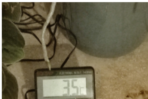
.noch ziemlich kalt früh...