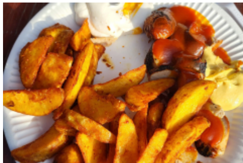
Was es unter anderem zu Essen gibt