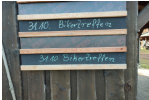
ah da sind wir!