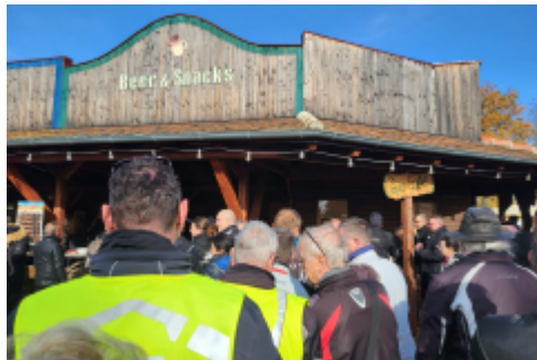
huch es werden immer mehr Leute