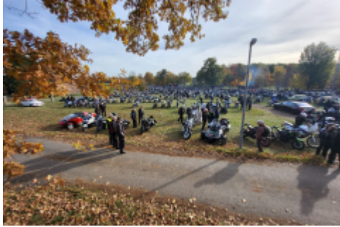
viel los auf dem Parkplatz