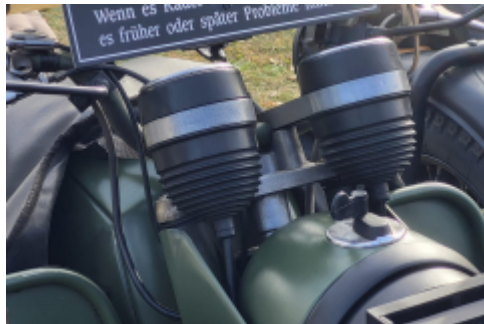
hmmm, wer will da widersprechen?