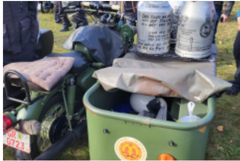
auch ein Mopped