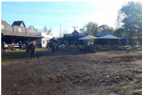
in der Forest village Ranch