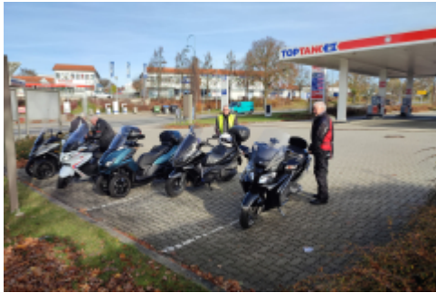
... und einzelne Menschen