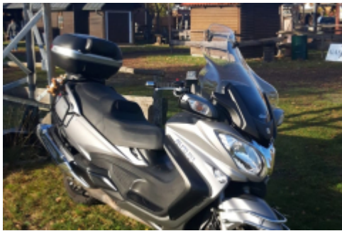
Der Jörg ist schon längst da...