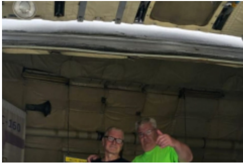
nochmal zwei Interessierte