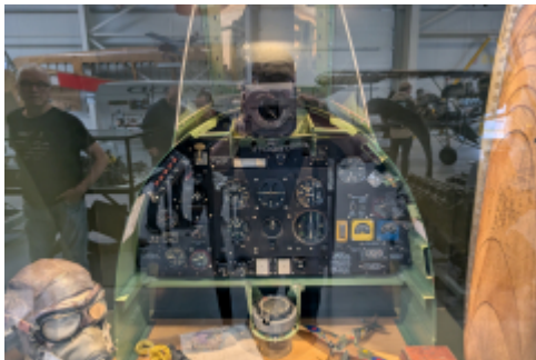
gentlemandd: "selbst mein Cockpit ist einfacher"