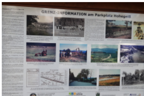
... auf vielen Schildern