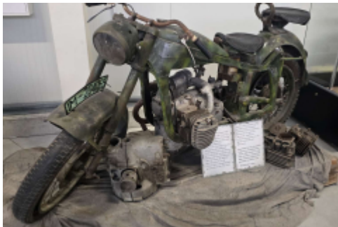
kann zwar nicht fliegen, steht aber auch dort