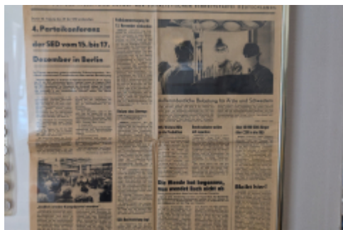
Zeitung der DDR