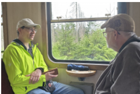
Auf Grund des Wetters mit der Brockenbahn unterwegs