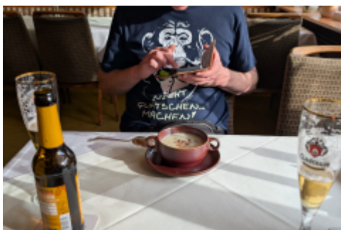
eine Knoblauchsuppe im "Berliner Hof" (Das Bild gehört hier nicht dazwischen, wir wollten es nur mit