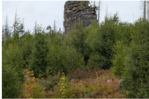
Feuersteinklippe, Namensgeber für den berühmten "Schierker Feuerstein"