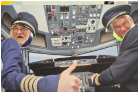
zwei Verrückte im Museum