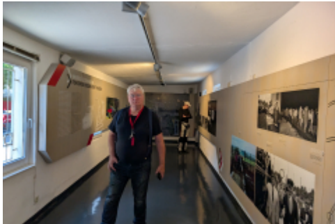
Menschen der DDR... ach quatsch... zwei Rollerfreunde in der Geschichte