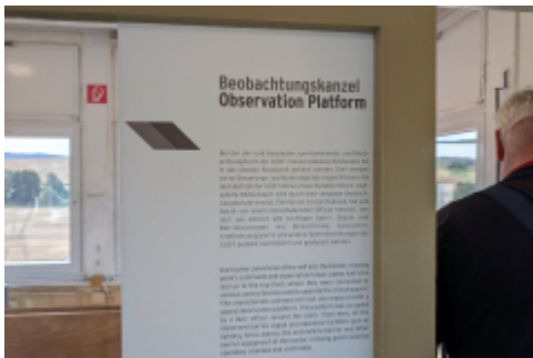
und wer lesen kann, der kann das auch