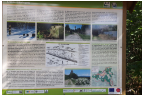
und einige Informationen...