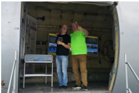
zwei Interessierte im Museum