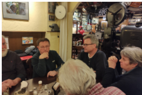
Bier oder andere Getränke kommen schnell...