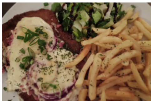
Bitteschön, da ist es - sehr lecker