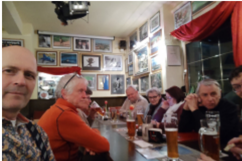
die eine Seite unserer Runde