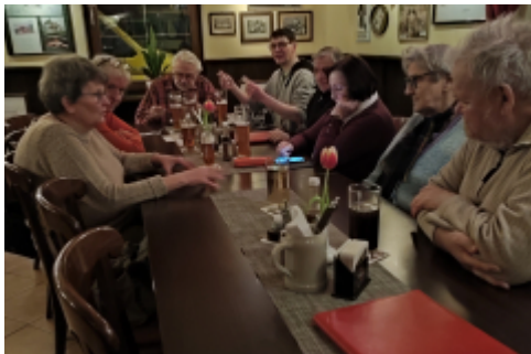
die andere Seite