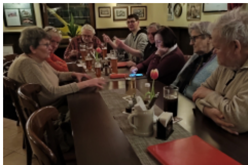
die andere Seite