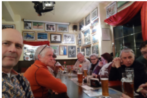
die eine Seite unserer Runde