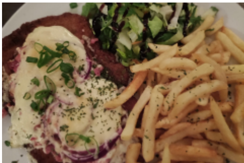
Bitteschön, da ist es - sehr lecker