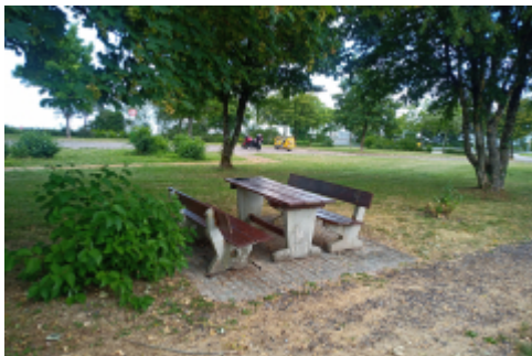
ein total überfüllter Rastplatz