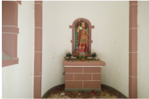
in der Kapelle