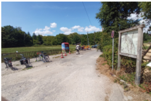
und weiter geht es