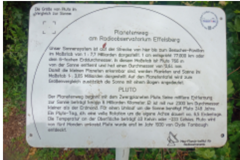
kleiner Abstecher zum Radioobservatorium