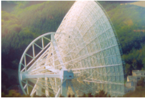
was für eine Riesenschüssel