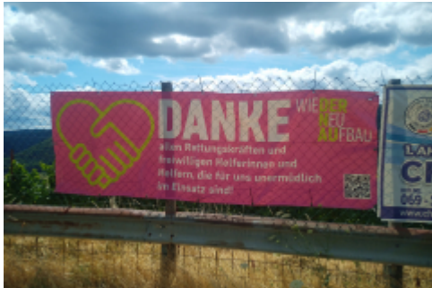
Wir waren leider nicht als Helfer da