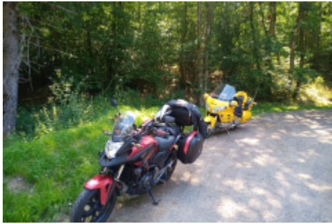
Rast am Wegesrand