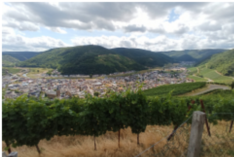
Wenn man sich den Talkessel ansieht, kann man sich das Leid annähernd vorstellen