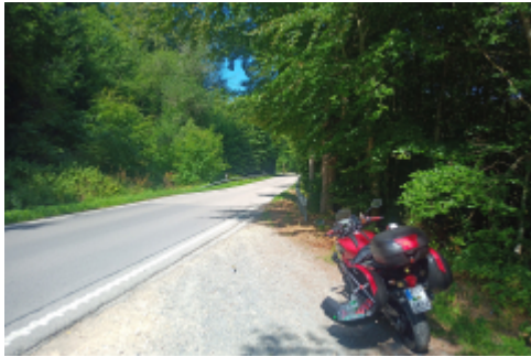
auf herrlichen Strecken...