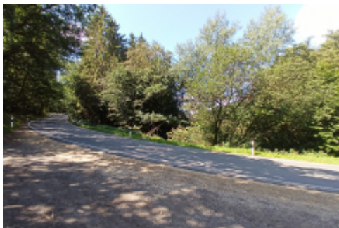
über kleine Straßen...