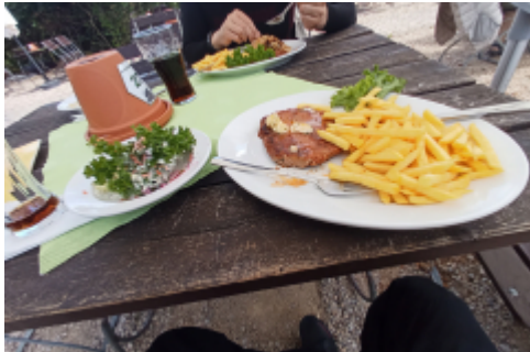
Mittag am Bahnhof Kottenforst