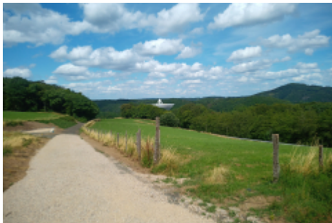
ab hier ist Handyverbot